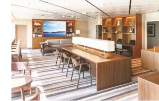
ブックラウンジ e-Square(イー・スクエア)(イメージ)