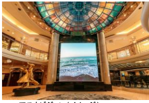
アスカビジョン(イメージ)