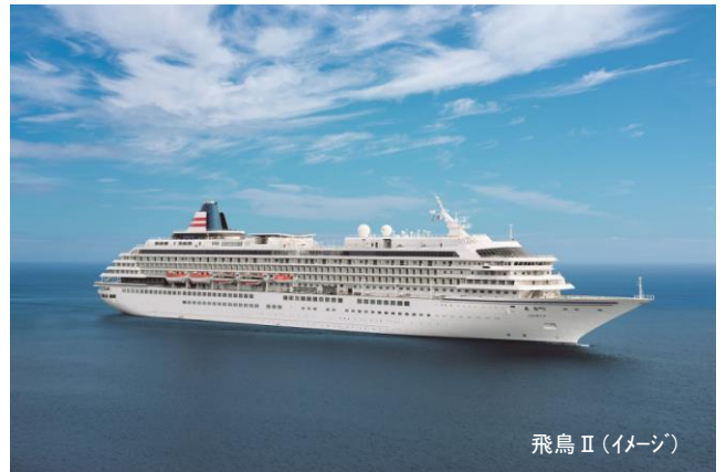
飛鳥 II (イメージ)