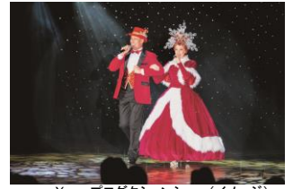
Xmasプロダクションショー(イメージ)