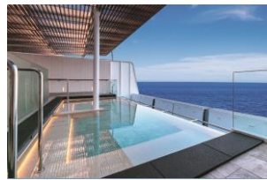
グランドスパ露天風呂(イメージ)