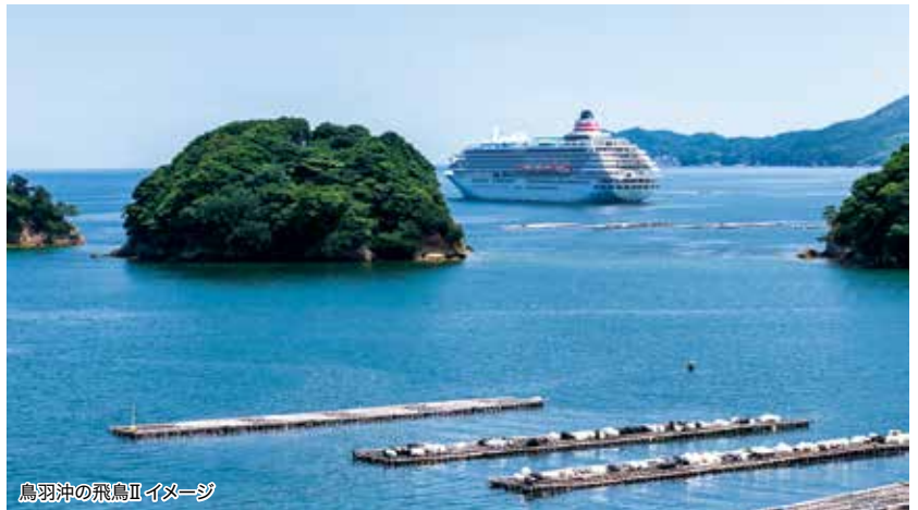
鳥羽沖の飛鳥IIイメージ

ミドルエイジ 10% 40～50歳代のお客様は旅行代金が 10%割引 になります。 ※ご本人様に限ります。 ※対象：①8月13日発：1961年8月14日～1981年8月15日生まれ。 ②8月28日発：1961年8月29日～1981年8月30日生まれ。 ③9月10日発：1961年9月11日～1981年9月12日生まれ。