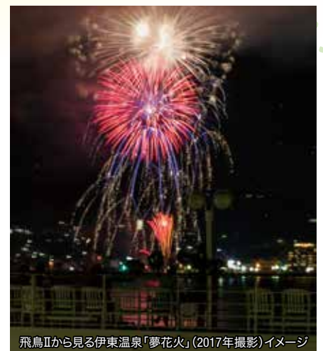
飛鳥IIから見る伊東温泉「夢花火」(2017年撮影)イメージ