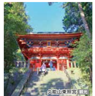
久能山東照宮 観光

■食事：①8/24発 ②9/3発 ③9/18発 朝2回、昼2回、夕2回 ④10/1発 朝2回、昼1回、夕2回 ※3日目横浜の入港時刻は、①8月24日発、②9月3日発、③9月18日発は14:00、④10月1日発は9:00を予定しています。 ※天候その他の事情により航路が変更となる場合がございます。 ※富士山は天候によりご覧いただけない場合がございます。この時期は冠雪の姿をご覧いただけません。