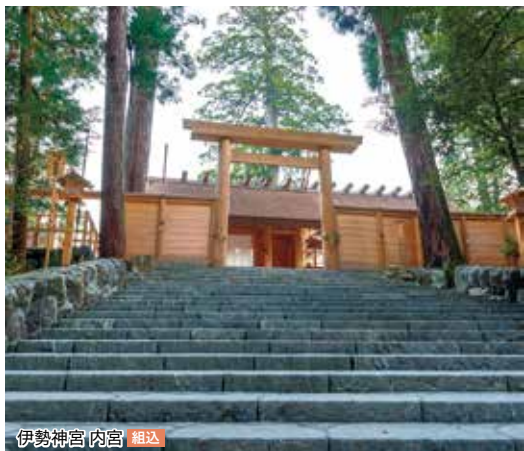
伊勢神宮 内宮 組込