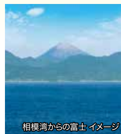
相模湾からの富士 イメージ

※①8月9日発は2021年6月時点でゲストエンターテイナーの乗船予定はございません。