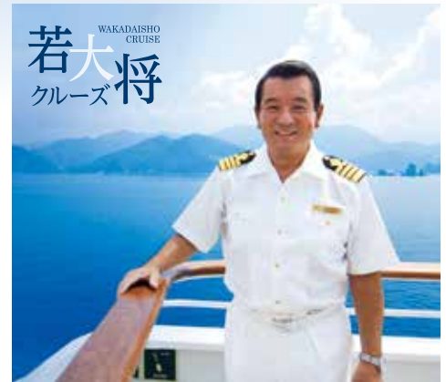
※写真は全てイメージです。イベント内容は変更、中止となる場合がございます。