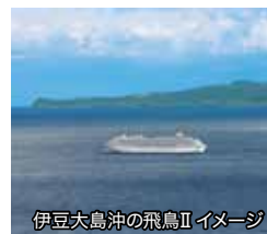
伊豆大島沖の飛鳥II イメージ