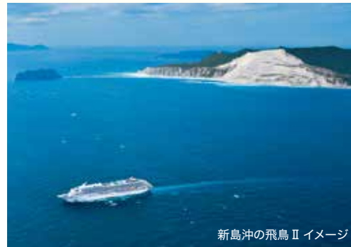
新島沖の飛鳥II イメージ

※②9月6日発、③9月21日発は2021年6月時点でゲストエンターテイナーの乗船予定はございません。