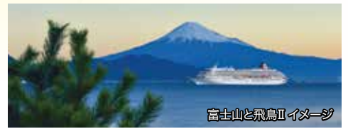
富士山と飛鳥IIイメー

ミドルエイジ10% 40～50歳代のお客様は旅行代金が10%割引になります。※ご本人様に限りませす。 ※対象：1961年8月7日～1981年8月8日生まれ。