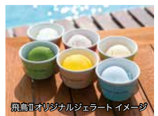
飛鳥IIオリジナルジェラートイメージ