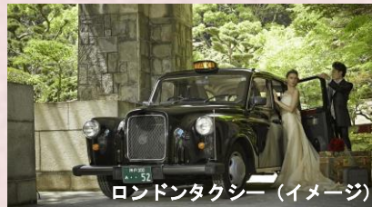
ロンドンタクシー（イメージ）