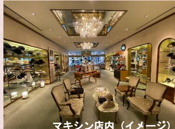
マキシン店内（イメージ）