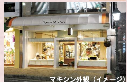
マキシン外観（イメージ）