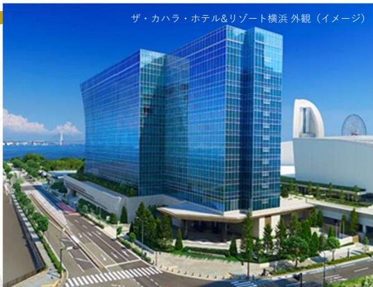
ザ・カハラ・ホテル&リゾート横浜 外観 (イメージ)