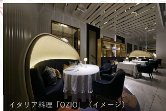
イタリア料理「OZIO」 (イメージ)