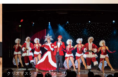
クリスマスショー(イメージ)