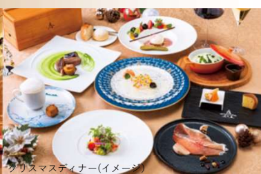
クリスマスディナー(イメージ)