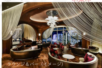
ラウンジ&バー (イメージ)

ゆったりご宿泊いただき、グラマラスで独創的なイタリアンレストラン「OZIO」でのご食や、水景と溶け合うモダンを極めた和の贅・・・広大な水庭に浮かべられた日本料理レストラン「濱」でのご朝食をお楽しみください。ショップでは、ハワイを感じるオリジナルグッズを探されても・・・