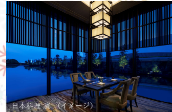
日本料理「濱」 (イメージ)