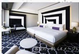
客室の一例 (イメージ)

ゆったりご宿泊いただき、グラマラスで独創的なイタリアンレストラン「OZIO」でのご食や、水景と溶け合うモダンを極めた和の贅・・・広大な水庭に浮かべられた日本料理レストラン「濱」でのご朝食をお楽しみください。ショップでは、ハワイを感じるオリジナルグッズを探されても・・・