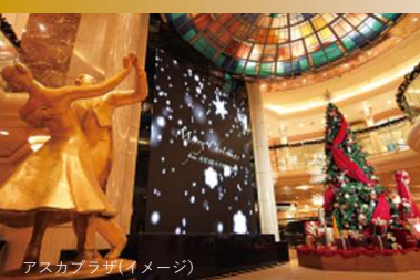
アストラカバラ(イメージ)

お食事などマスクを外される時間をより短くするために、ディナーは従来よりも速やかにご提供できるスタイルに変更します。また席も制限させていただきます。