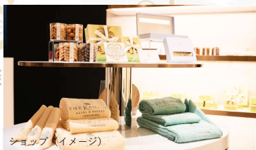
ショップ (イメージ)