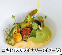
ニキヒルズワイナリー(イメージ)