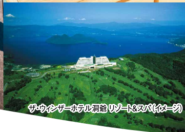
ザ・ウインザーホテル洞爺リゾート&スパ(イメージ)