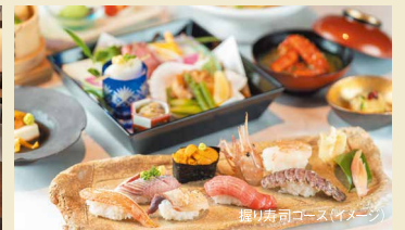
握り寿司コース(イメージ)