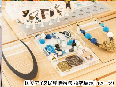
国立アイヌ民族博物館 探究展示(イメージ)