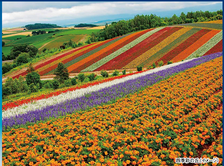
四季彩の丘(イメージ)