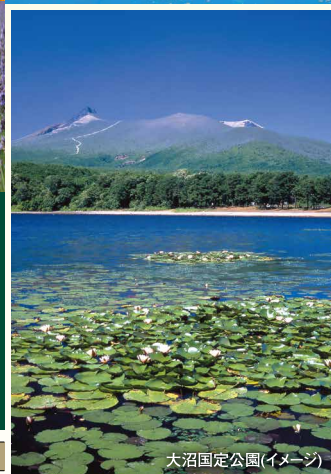
大沼国定公園(イメージ)