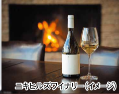
ニキヒルズワイナリー(イメージ)