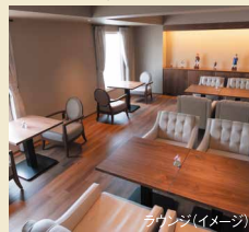
ラウンジ(イメージ)