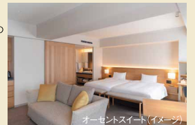
オーセントスイート(イメージ)

・オーセントスイート(54㎡) ご希望のお客様は追加料金:お一人様:15,000円(2名様1室利用) 25,000円(1名様1室利用)にて承ります。 ツアーご予約時にお問い合わせください。