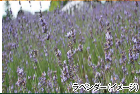
ラベンダー(イメージ)

美瑛では、圧倒的スケールの展望花畑「四季彩の丘」や絶景スポット「パッチワークの路(車窓より)」、エメラルドグリーンやライトブルーに変化する澄んだ水面と、林立するカラマツが幻想的な雰囲気「白金青い池」を訪れます。虹のようにカラフルな花畑で知られる農園「ファーム富田」では、遅咲きのラベンダー「ラバンジン」が例年見頃を迎えます。