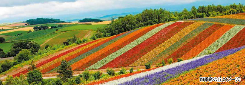
四季彩の丘(イメージ)