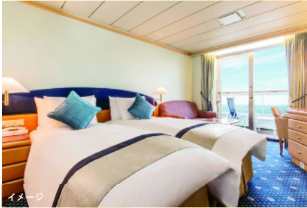
※写真は、Eバルコニー

■飛鳥IIの代表的な客室 「D:バルコニー」と「E:バルコニー」。 バルコニーから望む大海原がなんとも気持ち良い。