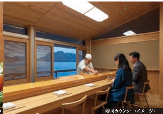
寿司カウンター(イメージ)