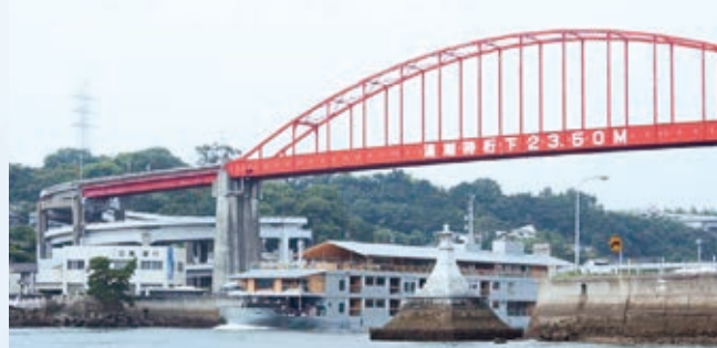
音戸の瀬戸(イメージ)