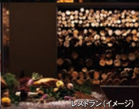
レストラン (イメージ)