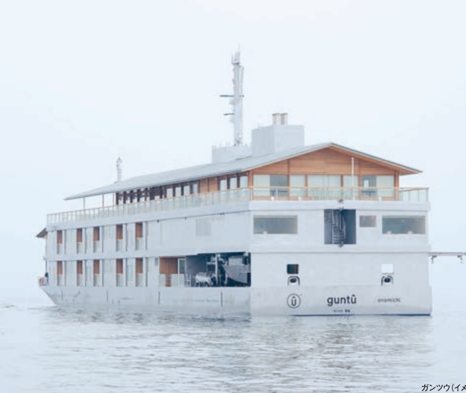
ガンツウ(イメージ)