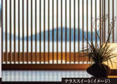
テラススイート(イメージ)

せとうちの海に浮かぶ、ちいさな宿。 鳥々が織りなす瀬戸内海の風景と、ささやかに営まれる島の日常に出逢う旅。 せとうちに漂いながら、穏やかなその風土に、ゆっくり溶け込んでいく。 落ち着いた船内で、思いのままに過ごす。 刻一刻と表情を変える繊細な山並み、そして海の色。 船そのものが、せとうちの優美な自然や豊かな文化の一部となって その魅力を発見し、表現し、つないでいく。 宝石箱のように美しい海の真ん中から、せとうちの魅力に出逢う旅へ。