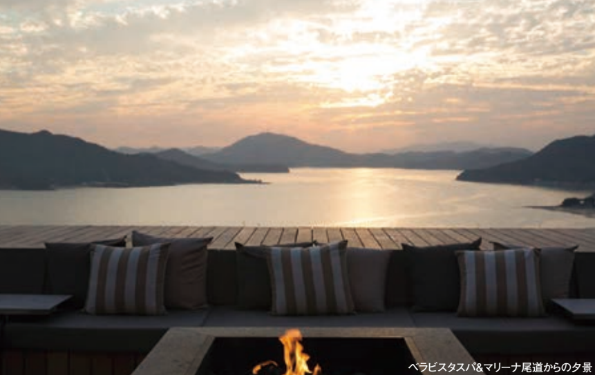
ベラビスタスパ&マリーナ尾道からの夕景