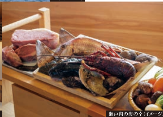
瀬戸内の海の幸(イメージ)