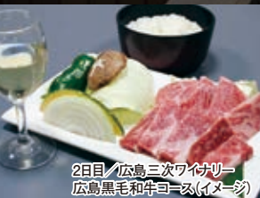
2日目 広島三次ワイナリー 広島黒毛和牛ヨース (イメージ)