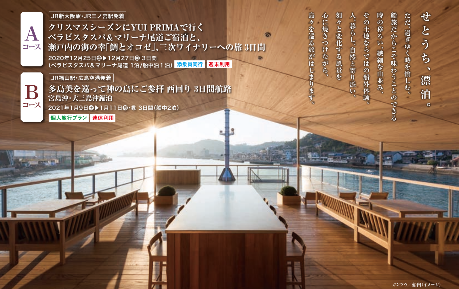
ガンツウ / 船内(イメージ)

せとうち、漂泊。 ただ、過ぎゆく時を愉しむ。 船旅だからこそ味わうことのできる 時の移ろい、繊細な山並み、 その土地ならではの船外体験。 人、暮らし、自然と寄り添い、 刻々と変化する風景を 心に焼きつけながら、 島々を巡る旅がはじまります。