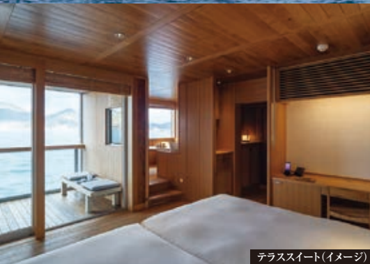
テラススイート(イメージ)

せとうちの海に浮かぶ、ちいさな宿。 鳥々が織りなす瀬戸内海の風景と、ささやかに営まれる島の日常に出逢う旅。 せとうちに漂いながら、穏やかなその風土に、ゆっくり溶け込んでいく。 落ち着いた船内で、思いのままに過ごす。 刻一刻と表情を変える繊細な山並み、そして海の色。 船そのものが、せとうちの優美な自然や豊かな文化の一部となって その魅力を発見し、表現し、つないでいく。 宝石箱のように美しい海の真ん中から、せとうちの魅力に出逢う旅へ。