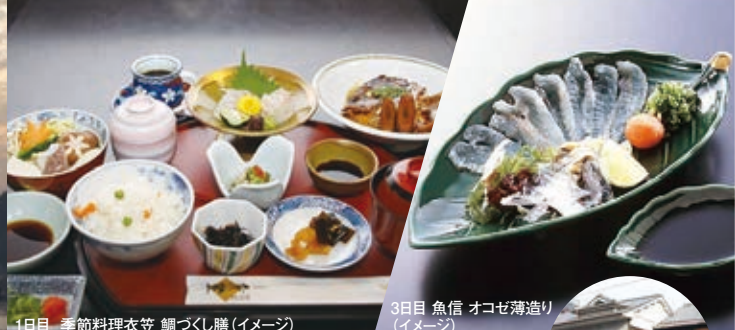
1日目 季節料理衣笠 鯛づくし膳 (イメージ)