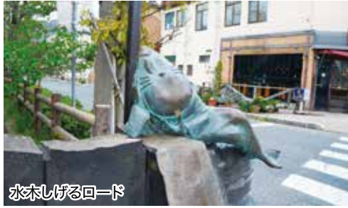
水木しげるロード