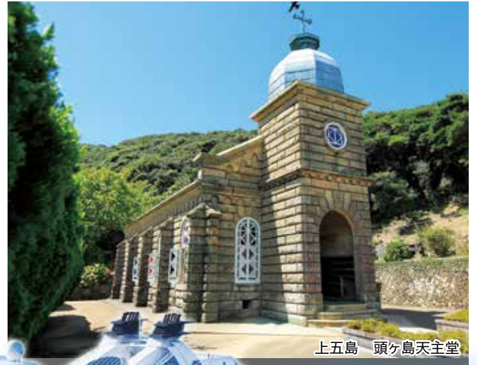
上五島 頭ヶ島天主堂