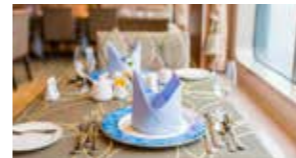
メインダイニング 瑞穂

クルーズ船にはドレスコードがあります。(夕刻以降のみ)ドレスコードには、カジュアル・セミフォーマル・フォーマルの3つがあり、今回のクルーズは「カジュアル」。男性は襟のあるシャツと長ズボン。女性は少しお洒落に。「気取りすぎず普段着にならない」がポイントです。