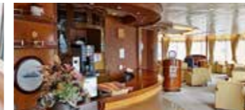
ホライズンラウンジ