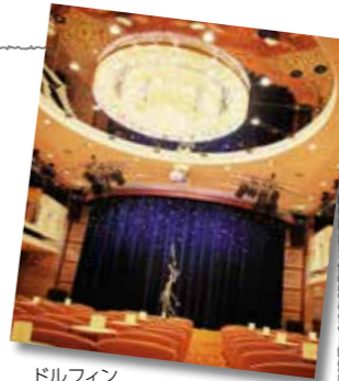
ドルフィンホール