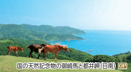
国の天然記念物の御崎馬と都井岬(日南) OP