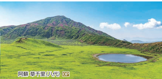
阿蘇 草千里(八代) OP