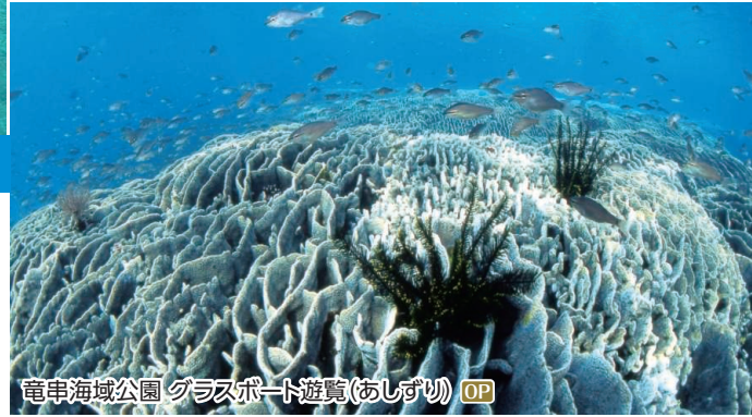
竜串海域公園 グラスボート遊覧(あしずり) OP