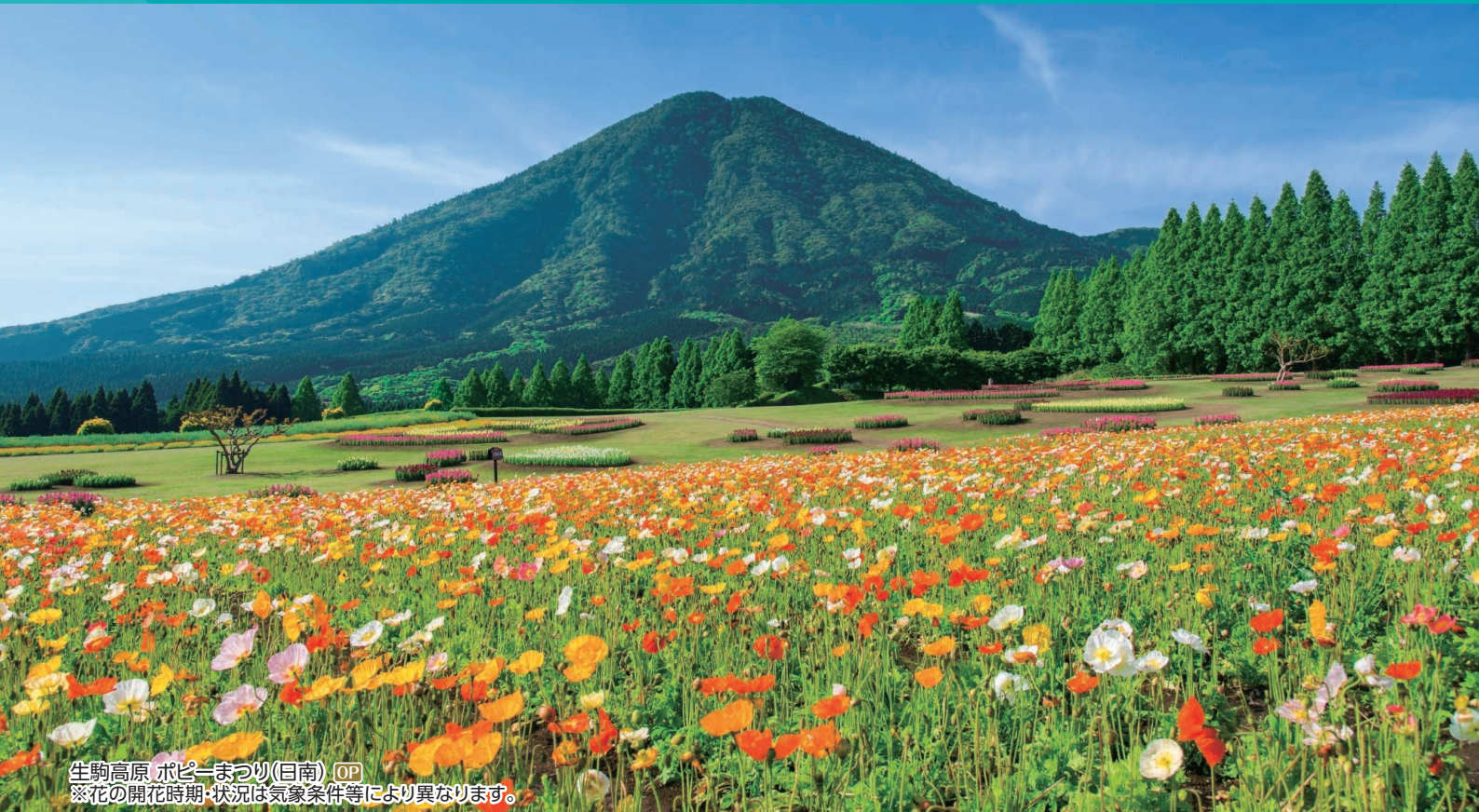
生駒高原 ポピーまつり(日南) OP ※花の開花時期・状況は気象条件等により異なります。