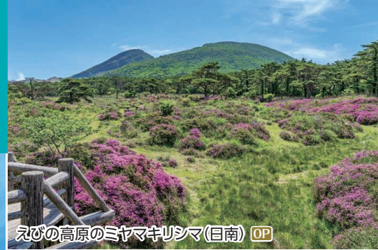
えびの高原のミヤマキリシマ(目南) OP