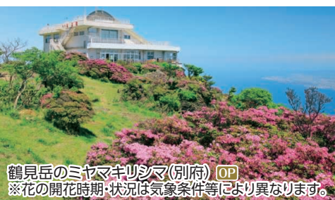
鶴見岳のミヤマキリシマ(別府) OP