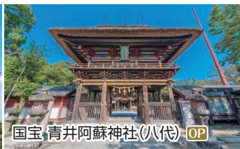
国宝 青井阿蘇神社(八代) OP