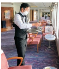
景色を楽しみながらティータイムを。