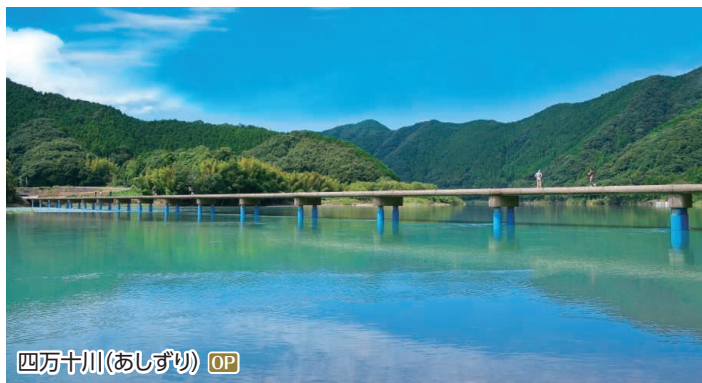
四万十川(あしずり) OP

●お食事 / 朝食3回・昼食3回・夕食3回 ●ドレスコード / すべてカジュアル ●記載しているスケジュール・寄港地・航路・船内イベントは、気象・海象条件、新型コロナウイルスの感染状況、寄港地の受入れ状況、その他の事由により変更・中止となる場合がございます。