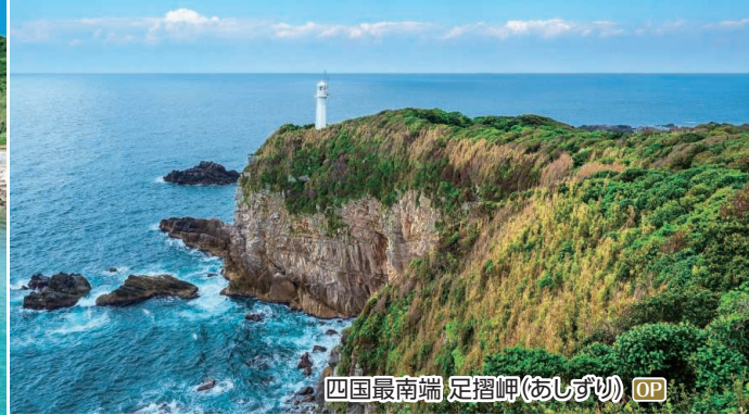
四国最南端 足摺岬(あしずり) OP