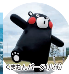
くまモンパーク(八代)