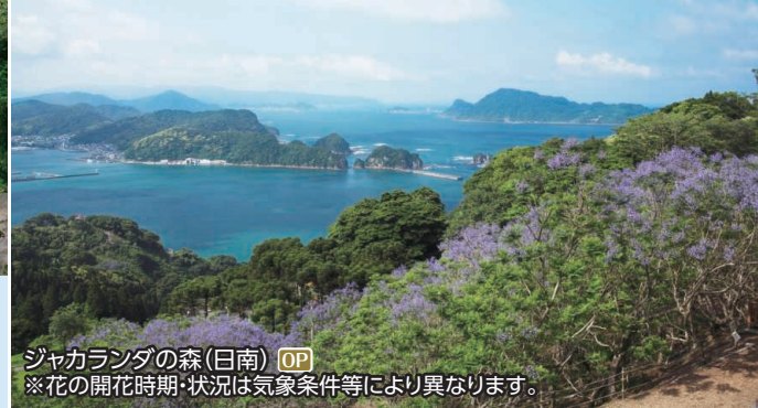
ジャカラダの森(日南) OP