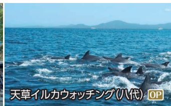
天草イルカウォッチング(八代) OP