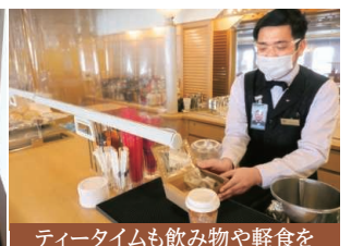
ティータイムも飲み物や軽食をテイクアウトできますので客室でもお召し上がりいただけます。