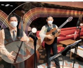
感染症対策(一例) メインホール・メインラウンジは席の間隔をあけてお座りいただけます。