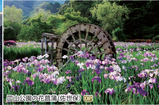
皿山公園の花菖蒲(佐世保) OP