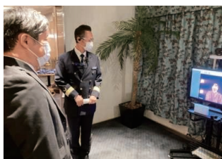
レストランでの検温

変わらない美味しさにより安心と安全を添えてお食事・ティータイムなどビュッフェを取り止め、スタッフが取り分けてご提供します。