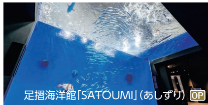
足摺海洋館「SATOUMI」(あしずり) OP