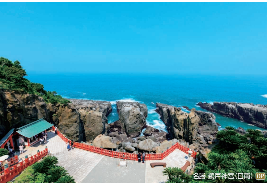
名勝 鶴戸神社(日南) OP

足摺岬・金剛福寺、四万十川遊覧、佐田沈下橋 ◆所要時間:約7.5時間 ◆お食事:昼食付