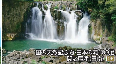
国の天然記念物・日本の滝100選 関之尾滝(日南) OP