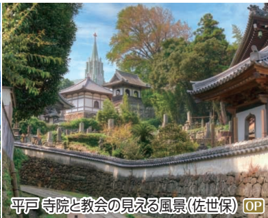
平戸 寺院と教会の見える風景(佐世保) OP