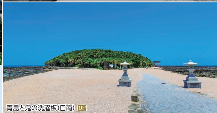
青島と鬼の洗濯板(日南) OP