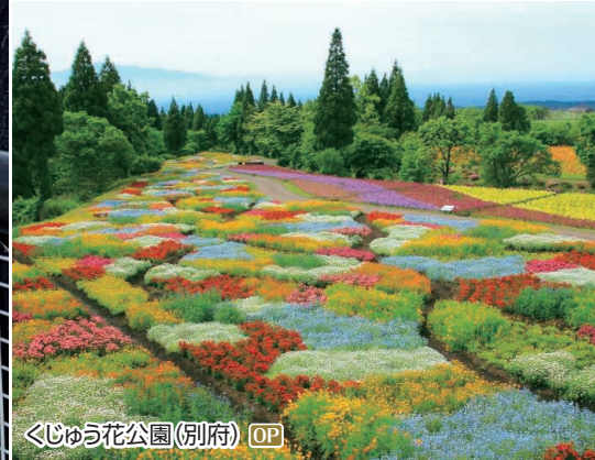
くじゅう花公園(別府) OP