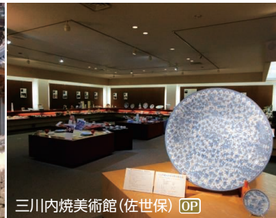
三川内焼美術館(佐世保) OP