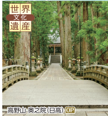
高野山・奥之院(日高) OP