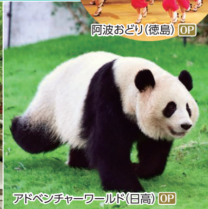
アドベンチャーワールド(日高) OP