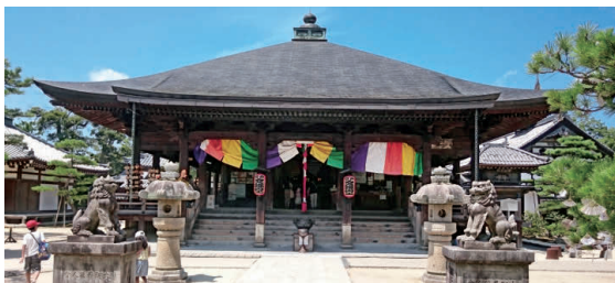
智恩寺 OP 「文殊堂」とも呼ばれ、知恵の神様・ 文殊菩薩を祀る日本三文殊の一つ