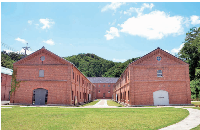
舞鶴赤れんがパーク OP 旧海軍舞鶴鎮守府の軍需品等の保管倉庫で、重要文化財に指定されている