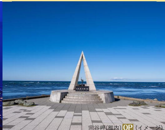
宗谷岬(稚内) OP (イメージ)