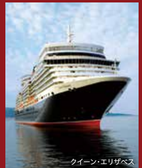
クイーン・エリザベス

※2名1室利用時、1人目・2人目のみ適用可能です。3名1室利用の場合、3人目の方は適用できません。 ※キャンセル待ちは対象外です。