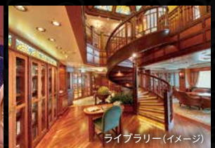
ライブラリー(イメージ)