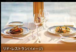
リド・レストラン(イメージ)