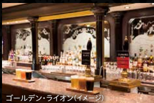
ゴールデン・ライオン(イメージ)