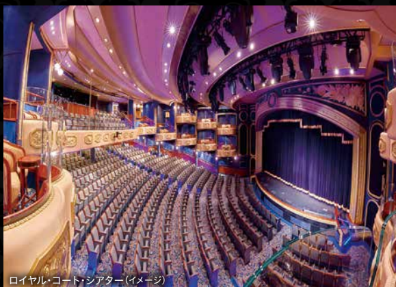
ロイヤル・コート・シアター(イメージ)