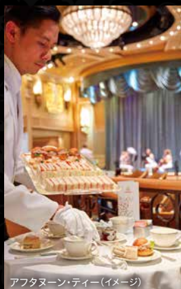
アフタヌーン・ティー(イメージ)

船内は木材を活かした落ち着いたクラシックな内装で、ロンドンのウェストエンドを彷彿とさせる本格的な劇場や、英国風パブランチが楽しめる伝統的なパブなどこだわり抜かれた空間が広がります。船体中央にある2階層吹き抜けのクイーンズ・ルームでは、オーケストラ生演奏に耳を傾けながら名物スコーンとともに伝統的なアフタヌーンティーを楽しむひとときや、夜の帳が下るとバンドの生演奏とともに社交ダンスもお楽しみいただけます。クルーズの黄金時代から語り継がれてきた伝統のホワイトスター・サービスを始め、洗練された英国式のサービスを提供しています。