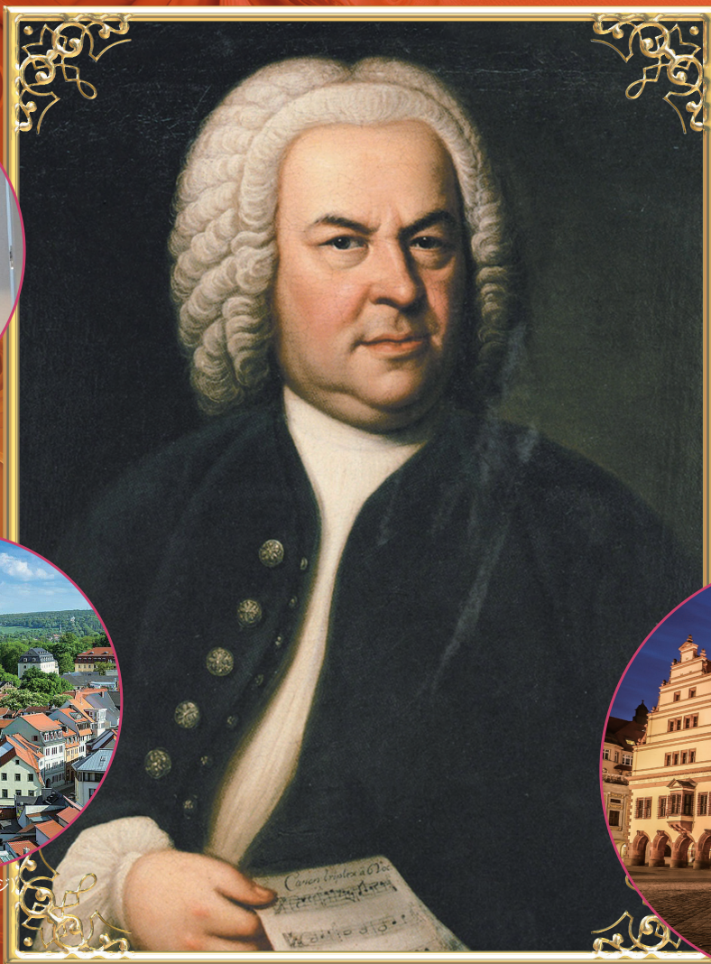
ライプツィヒ／聖トーマス教会(イメージ)

ザクセン、テューリンゲンにバッハゆかりの地を訪ね、ライプツィヒ・バッハフェスティバルで世界最高峰のバッハ演奏に出逢う！ 2000年以來延べ42回「バッハへの旅」 「続バッハへの旅」合計、延べ920名様 ご参加の、音楽ツアーのベストセラー！