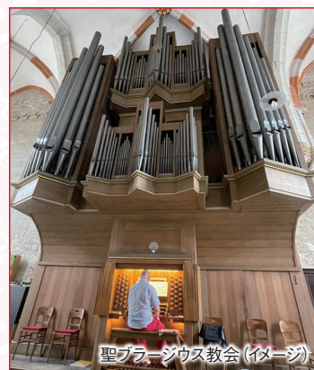
聖ブラージウス教会(イメージ)

「バッハへの旅」で聴いていただくのは、 音楽祭ではありません。バッハが弾い たオルガンの音色も、生地アイゼナッハでの バリオ楽器によるサロンコンサートも、旅の 一部です。現地でしか体験できない、バッ ハ当時の響きをご堪能ください。 1年で一番日の長い6月は、ヨーロッパを 旅するのに最適の季節。旬の白アスパラ ガスなど、食の楽しみにも事欠きません。 お泊まりには、四つ星の快適なホテルをご 用意しました。 ぜひこの機会に、深く、そして愉しくバッハを 知る旅をご一緒にしませんか? ご参加を心よりお待ちしております。